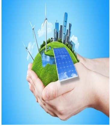
الطاقة المتجددة والبديلة