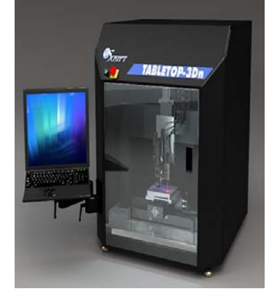
الطباعة ثلاثية الابعاد